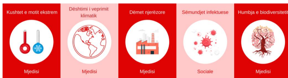
Figura 1: 5 Risqet kryesore të renditura për vitin 2021

Për herë të parë, raporti gjithashtu vlerëson risqet kur të anketuarit përceptojnë se do të paraqesin një kërcënim kritik për botën.