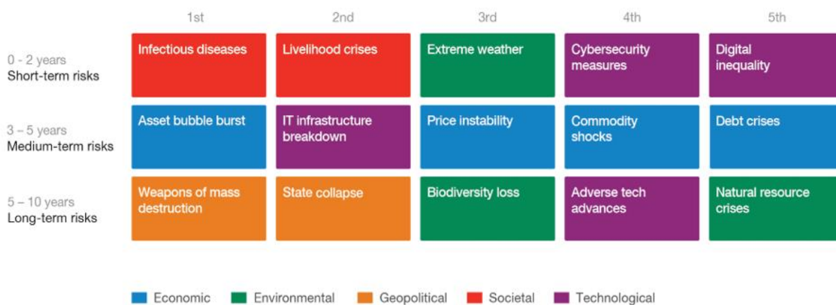
Figura 2: Harta e risqeve prioritare 2021